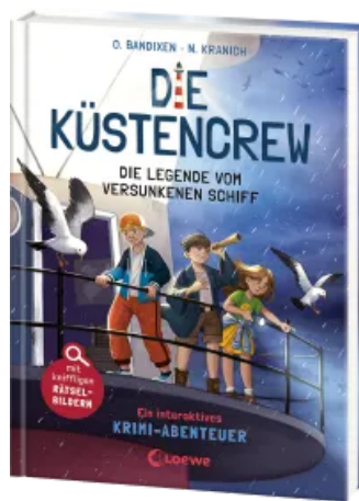
Die Küstencrew (Band 4) - Die Legende vom versunkenen Schiff Hardcover