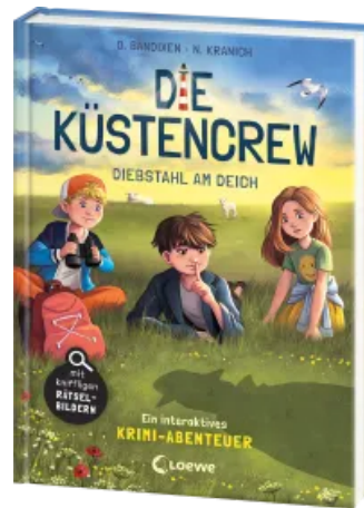
Die Küstencrew (Band 3) - Diebstahl am Deich Hardcover