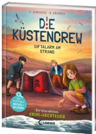
Die Küstencrew (Band 5) - Giftalarm am Strand Hardcover