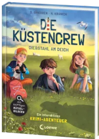
Die Küstencrew (Band 3) - Diebstahl am Deich Hardcover