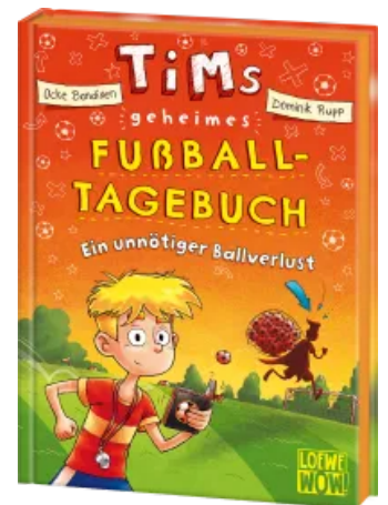
Tims geheimes Fußball- Tagebuch (Band 2) - Ein unnötiger Ballverlust Hardcover