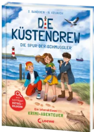
Die Küstencrew (Band 2) - Die Spur der Schmuggler Hardcover