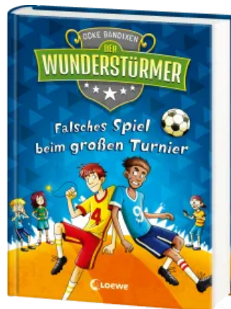
Der Wunderstürmer (Band 7) - Falsches Spiel beim großen Turnier Hardcover