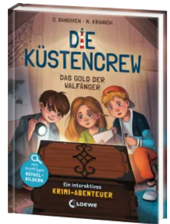
Die Küstencrew (Band 1) - Das Gold der Walfänger Hardcover