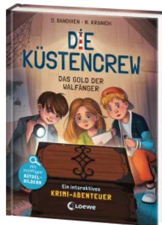
Die Küstencrew (Band 1) - Das Gold der Walfänger Hardcover