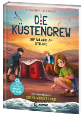
Die Küstencrew (Band 5) - Giftalarm am Strand Hardcover