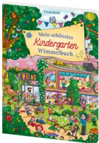
Mein schönstes Kindergarten-Wimmelbuch Hardcover