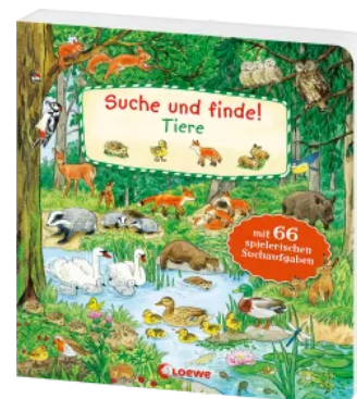
Suche und finde! - Tiere Hardcover