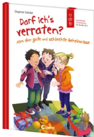
Darf ich's verraten? Alles über gute und schlechte Geheimnisse Hardcover