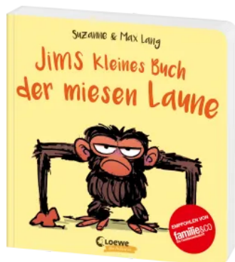
Jims kleines Buch der miesen Laune Hardcover