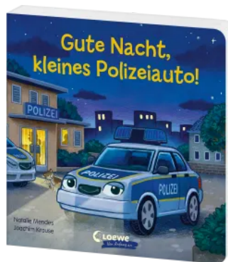
Gute Nacht, kleines Polizeiauto! Hardcover