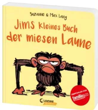
Jims kleines Buch der miesen Laune Hardcover