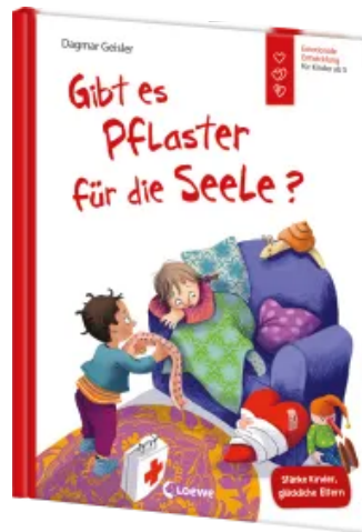
Gibt es Pflaster für die Seele? (Starke Kinder, glückliche Eltern) Hardcover