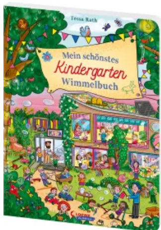
Mein schönstes Kindergarten-Wimmelbuch Hardcover