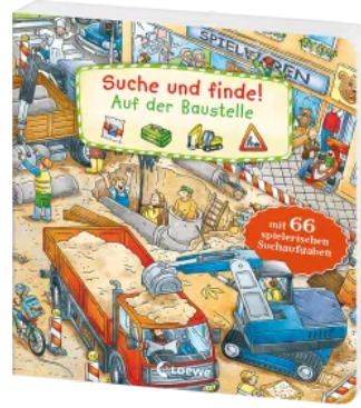
Suche und finde! - Auf der Baustelle Hardcover