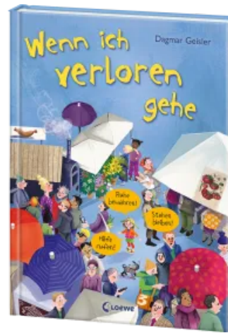
Wenn ich verloren gehe (Starke Kinder, glückliche Eltern) Hardcover