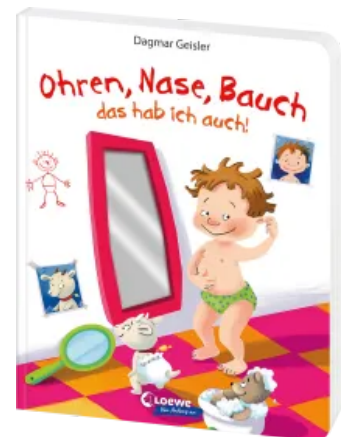
Ohren, Nase, Bauch - das hab ich auch! Hardcover