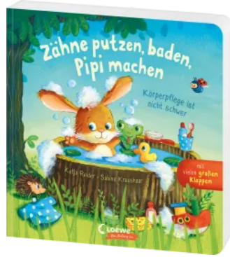
Zähne putzen, baden, Pipi machen - Körperpflege ist nicht schwer Hardcover