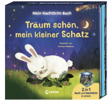
Träum schön, mein kleiner Schatz Hardcover