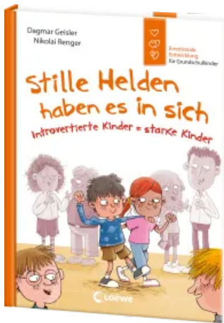
Stille Helden haben es in sich (Starke Kinder, glückliche Eltern) Hardcover