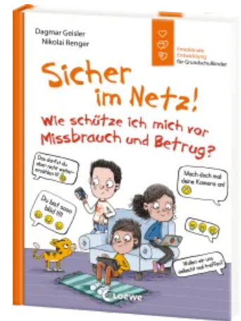
Sicher im Netz! Wie schütze ich mich vor Missbrauch und Betrug? (Starke Kinder, glückliche Eltern) Hardcover