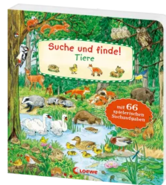
Suche und finde! - Tiere Hardcover