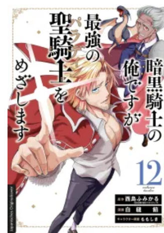
Dark Paladin 12 Taschenbuch