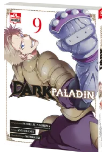
Dark Paladin 09 Taschenbuch