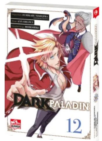
Dark Paladin 12 Taschenbuch