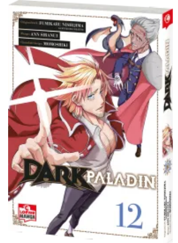
Dark Paladin 12 Taschenbuch