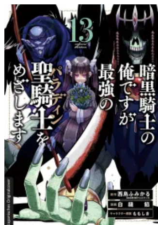
Dark Paladin 13 Taschenbuch