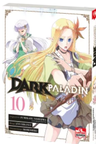
Dark Paladin 10 Taschenbuch