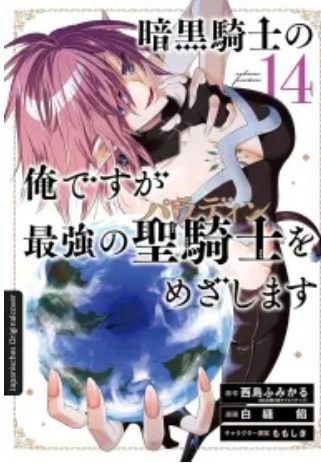
Dark Paladin 14 Taschenbuch