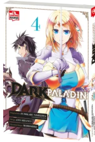
Dark Paladin 04 Taschenbuch