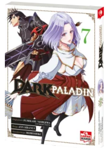
Dark Paladin 07 Taschenbuch