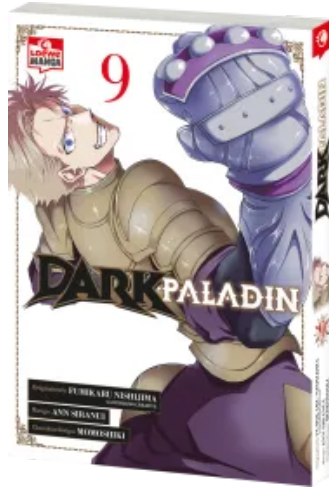
Dark Paladin 09 Taschenbuch