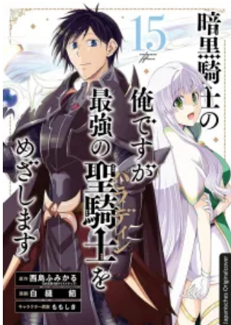
Dark Paladin 15 Taschenbuch