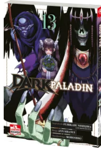
Dark Paladin 13 Taschenbuch