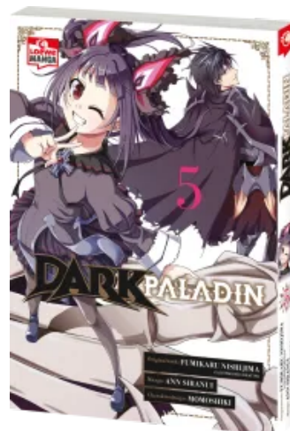
Dark Paladin 05 Taschenbuch