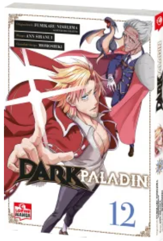
Dark Paladin 12 Taschenbuch