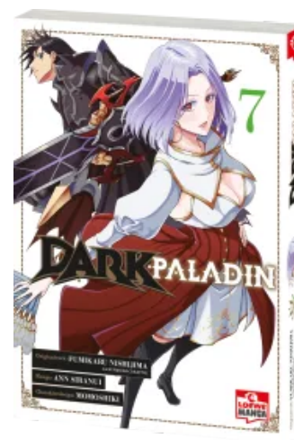
Dark Paladin 07 Taschenbuch