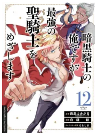
Dark Paladin 12 Taschenbuch