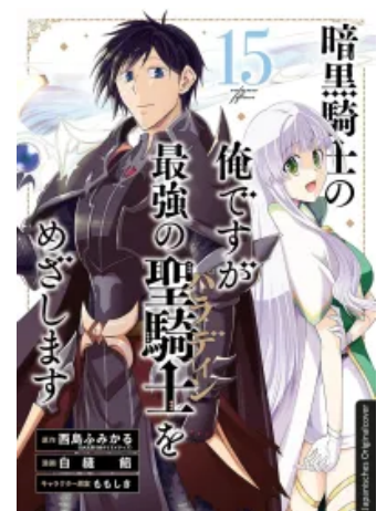
Dark Paladin 15 Taschenbuch