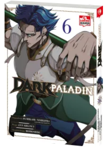
Dark Paladin 06 Taschenbuch