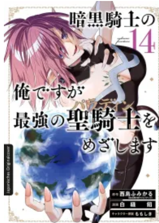
Dark Paladin 14 Taschenbuch