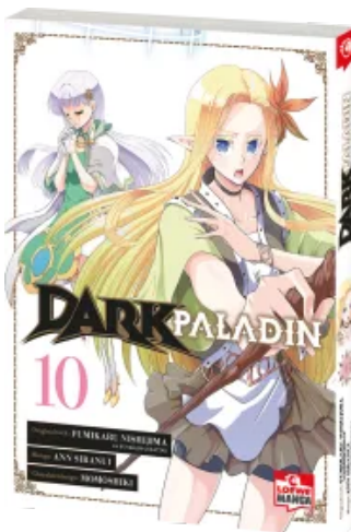
Dark Paladin 10 Taschenbuch