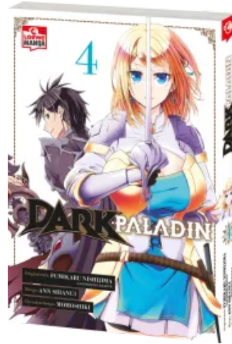
Dark Paladin 04 Taschenbuch