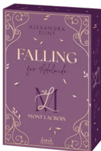
Mont Lacroix (Band 2) - Falling for Adelaide Paperback