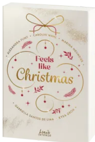
Feels like Christmas Paperback