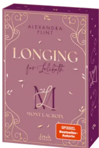
Mont Lacroix (Band 1) - Longing for Lelibeth Paperback