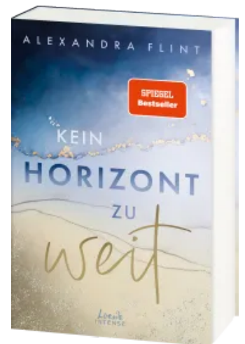
Kein Horizont zu weit (Tales of Sylt, Band 1) Paperback