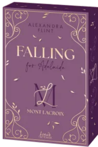
Mont Lacroix (Band 2) - Falling for Adelaide Paperback