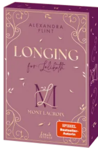
Mont Lacroix (Band 1) - Longing for Lelibeth Paperback