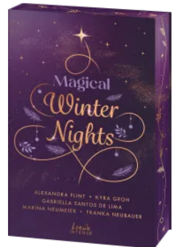
Magical Winter Nights Paperback