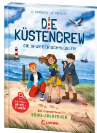
Die Küstencrew (Band 2) - Die Spur der Schmuggler Hardcover