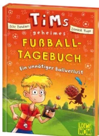
Tims geheimes Fußball- Tagebuch (Band 2) - Ein unnötiger Ballverlust Hardcover