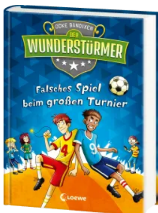
Der Wunderstürmer (Band 7) - Falsches Spiel beim großen Turnier Hardcover