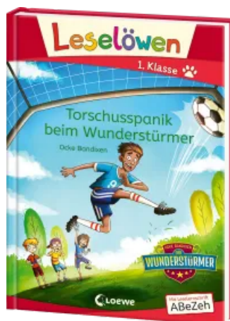
Leselöwen 1. Klasse - Torschusspanik beim Wunderstürmer Hardcover