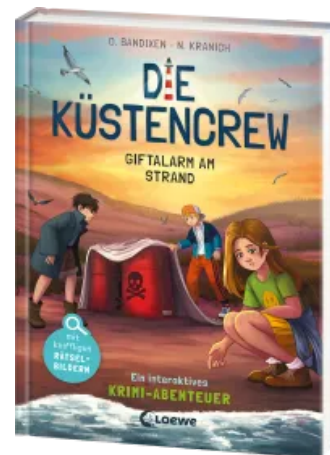
Die Küstencrew (Band 5) - Giftalarm am Strand Hardcover