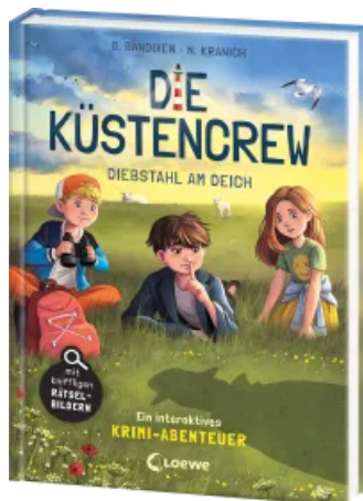
Die Küstencrew (Band 3) - Diebstahl am Deich Hardcover