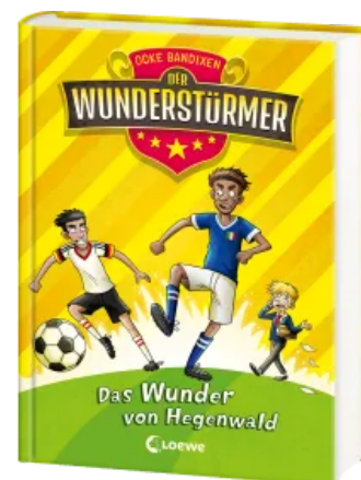
Der Wunderstürmer (Band 6) - Das Wunder von Hegenwald Hardcover