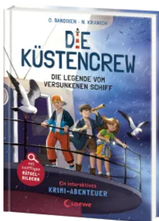
Die Küstencrew (Band 4) - Die Legende vom versunkenen Schiff Hardcover