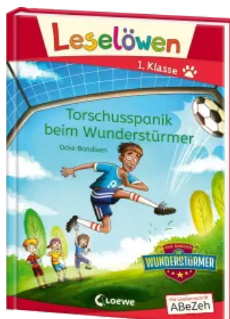
Leselöwen 1. Klasse - Torschusspanik beim Wunderstürmer Hardcover