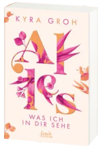
Alles, was ich in dir sehe (Alles-Trilogie, Band 1) Paperback