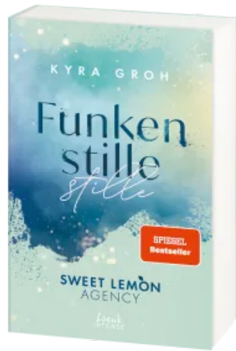
Funkenstille (Sweet Lemon Agency, Band 3) Paperback