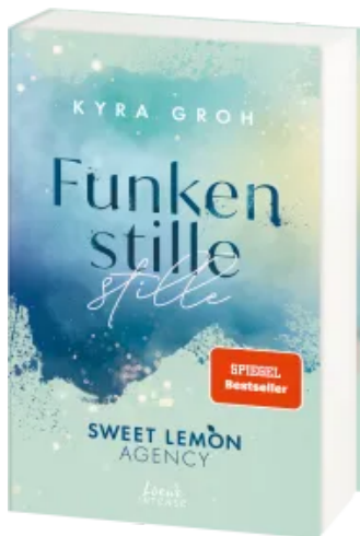
Funkenstille (Sweet Lemon Agency, Band 3) Paperback