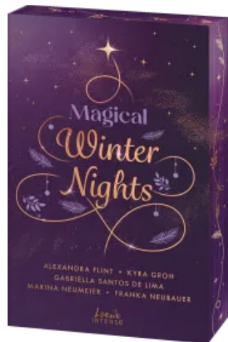
Magical Winter Nights Paperback