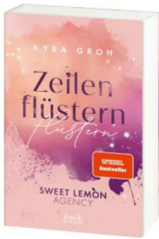
Zeilenflüstern (Sweet Lemon Agency, Band 1) Paperback