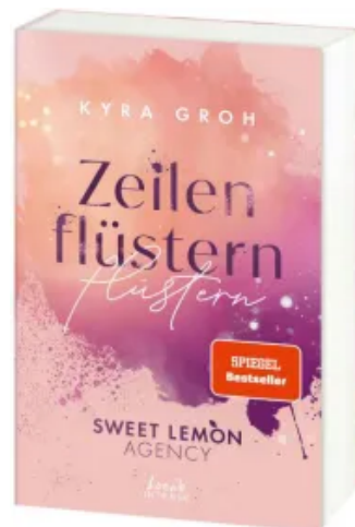
Zeilenflüstern (Sweet Lemon Agency, Band 1) Paperback