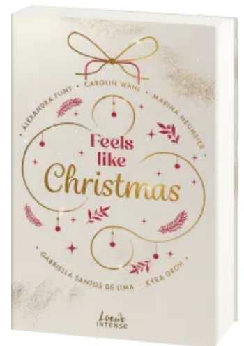
Feels like Christmas Paperback