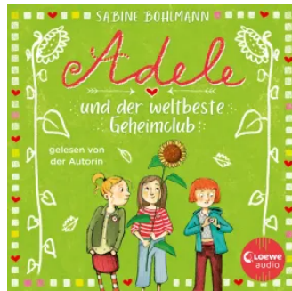
Adele und der weltbeste Geheimclub Hörbuch