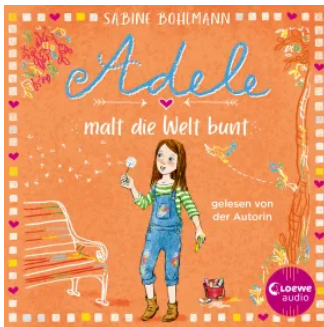
Adele malt die Welt bunt Hörbuch