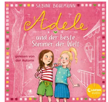
Adele und der beste Sommer der Welt Hörbuch