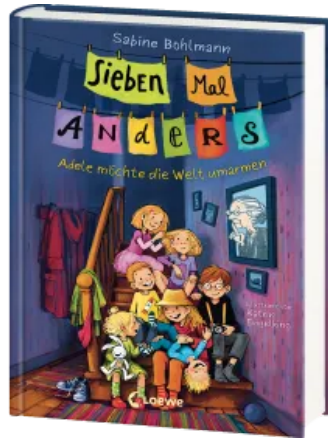
Sieben Mal Anders (Band 1) - Adele möchte die Welt umarmen Hardcover