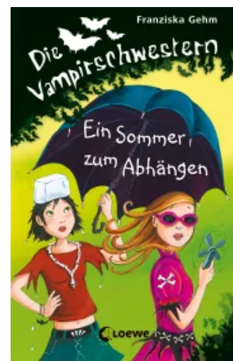
Die Vampirschwestern (Band 9) - Ein Sommer zum Abhängen Hardcover