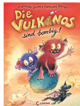
Die Vulkanos sind bombig! (Band 2) Hardcover