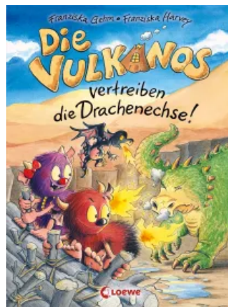
Die Vulkanos vertreiben die Drachenechse! (Band 8) Hardcover