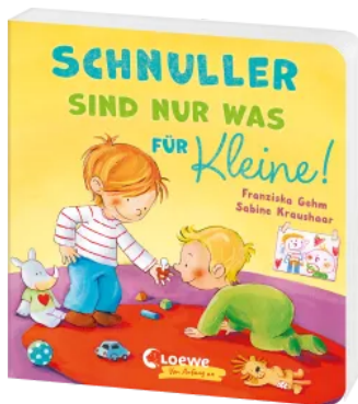
Schnuller sind nur was für Kleine! Hardcover