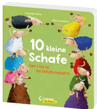
10 kleine Schafe Hardcover