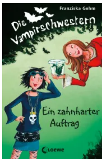
Die Vampirschwestern (Band 3) - Ein zahnharter Auftrag Hardcover