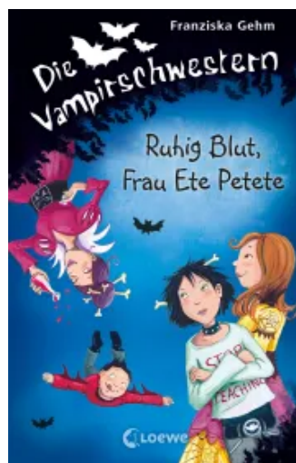
Die Vampirschwestern (Band 12) - Ruhig Blut, Frau Ete Petete Hardcover