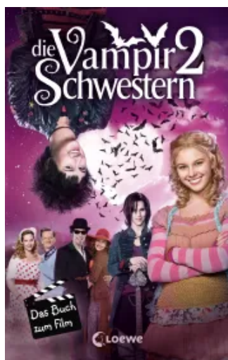
Die Vampirschwestern 2 - Das Buch zum Film Hardcover