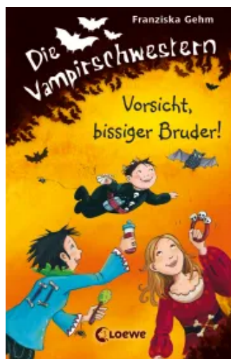
Die Vampirschwestern (Band 11) - Vorsicht, bissiger Bruder! Hardcover