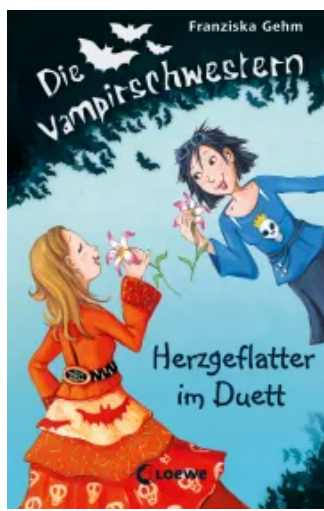
Die Vampirschwestern (Band 4) - Herzgeflatter im Duett Hardcover