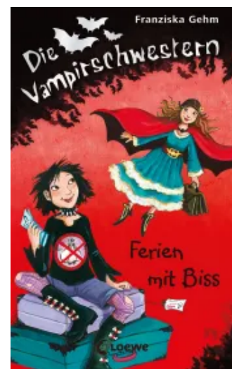
Die Vampirschwestern (Band 5) - Ferien mit Biss Hardcover