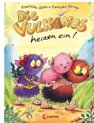
Die Vulkanos heizen ein! (Band 6) Hardcover