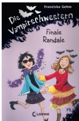
Die Vampirschwestern (Band 13) - Finale Randale Hardcover