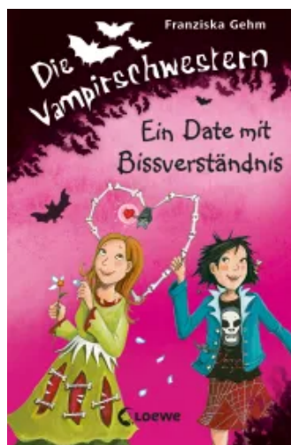
Die Vampirschwestern (Band 10) - Ein Date mit Bissverständnis Hardcover