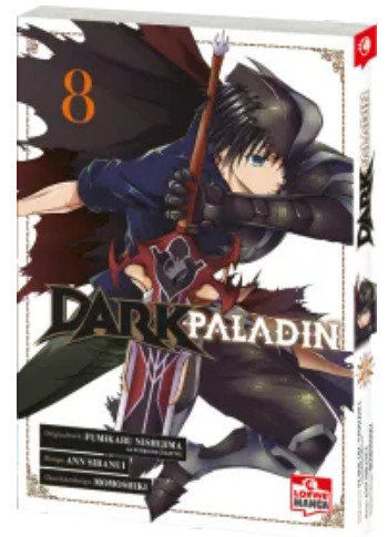
Dark Paladin 08 Taschenbuch