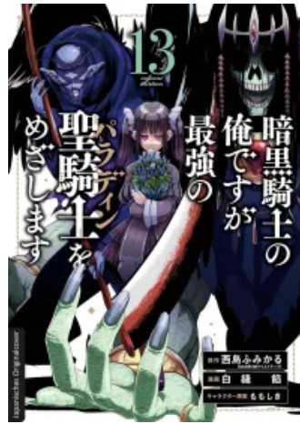
Dark Paladin 13 Taschenbuch