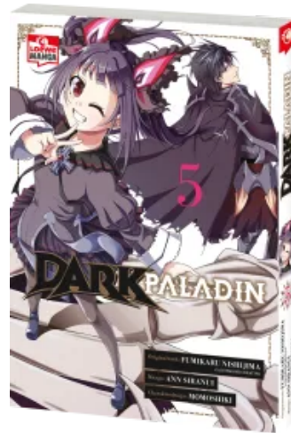
Dark Paladin 05 Taschenbuch