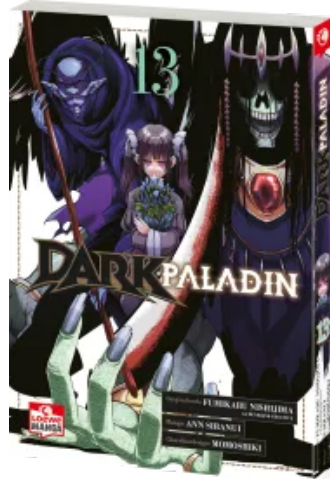
Dark Paladin 13 Taschenbuch