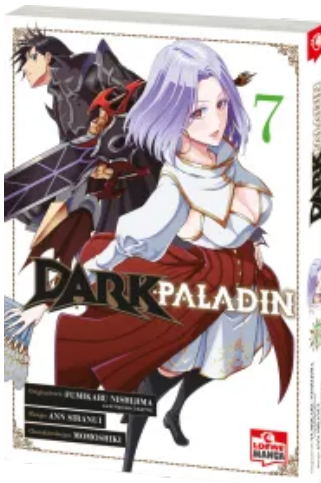
Dark Paladin 07 Taschenbuch