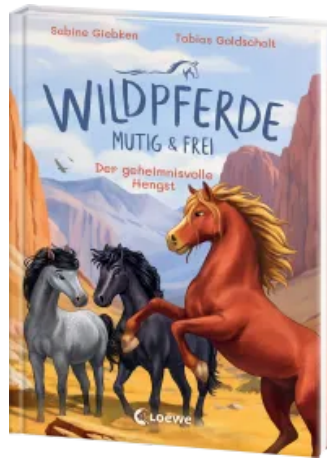
Wildpferde - mutig und frei (Band 7) - Der geheimnisvolle Hengst Hardcover