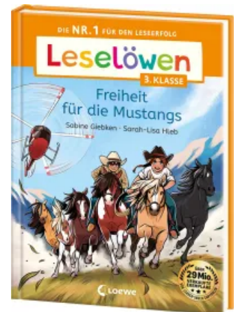
Leselöwen 3. Klasse - Freiheit für die Mustangs Hardcover