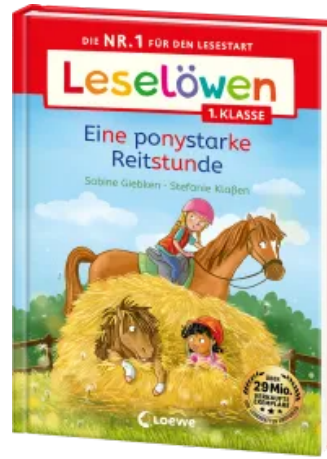
Leselöwen 1. Klasse - Eine ponystarke Reitstunde Hardcover