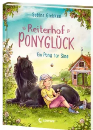
Reiterhof Ponyglück (Band 1) - Ein Pony für Sina Hardcover