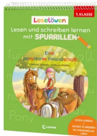
Leselöwen - Lesen und schreiben lernen mit Spurrillen - Eine ponystarke Freundschaft Taschenbuch