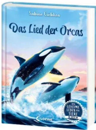
Das geheime Leben der Tiere (Meer) - Das Lied der Orcas Hardcover