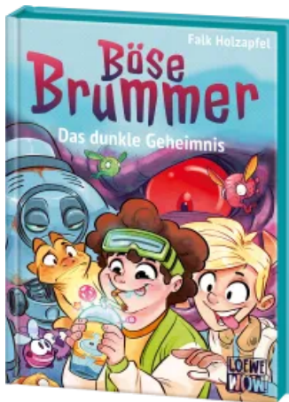
Böse Brummer (Band 2) - Das dunkle Geheimnis Hardcover