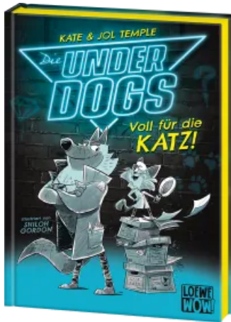
Die Underdogs (Band 1) - Voll für die Katz! Hardcover