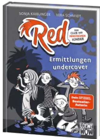
Red - Der Club der magischen Kinder (Band 2) - Ermittlungen undercover Hardcover