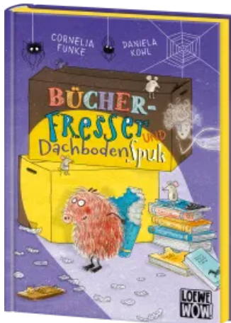
Bücherfresser und Dachbodenspuk Hardcover