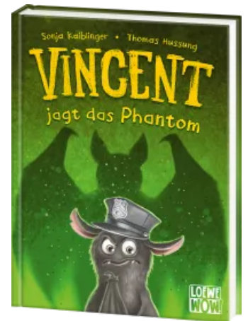
Vincent jagt das Phantom (Band 5) Hardcover