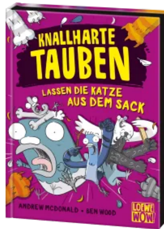
Knallharte Tauben lassen die Katze aus dem Sack (Band 5) Hardcover