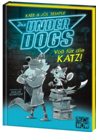
Die Underdogs (Band 1) - Voll für die Katz! Hardcover