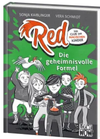
Red - Der Club der magischen Kinder (Band 3) - Die geheimnisvolle Formel Hardcover