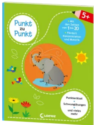
Punkt zu Punkt - Mit den Zahlen von 1 bis 20 (grün) Taschenbuch