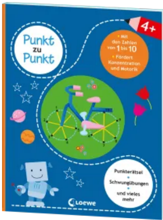
Punkt zu Punkt - Mit den Zahlen von 1 bis 10 (blau) Taschenbuch