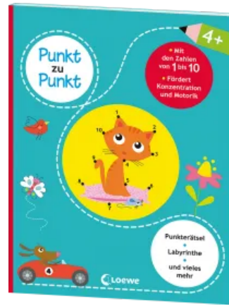
Punkt zu Punkt - Mit den Zahlen von 1 bis 10 Taschenbuch