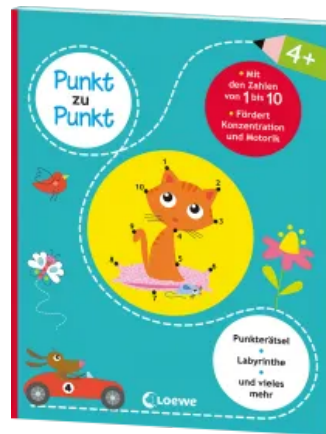
Punkt zu Punkt - Mit den Zahlen von 1 bis 10 Taschenbuch