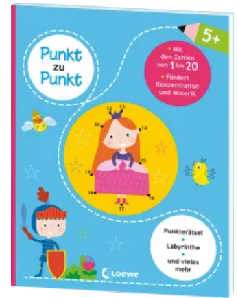
Punkt zu Punkt - Mit den Zahlen von 1 bis 20 Taschenbuch