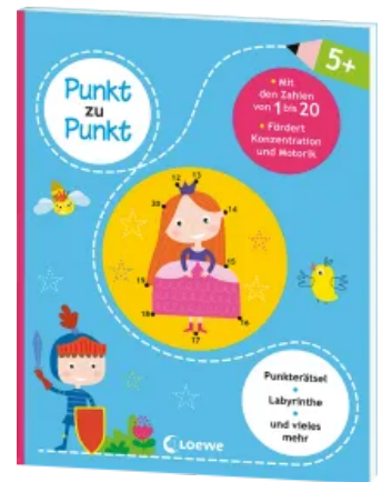
Punkt zu Punkt - Mit den Zahlen von 1 bis 20 Taschenbuch