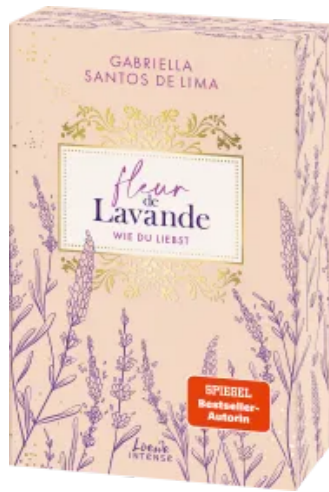
Fleur de Lavande (Band 1) - Wie du liebst Paperback