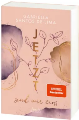
Jetzt sind wir eins (Jetzt-Trilogie, Band 2) Paperback