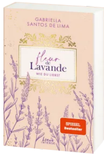
Fleur de Lavande (Band 1) - Wie du liebst Paperback