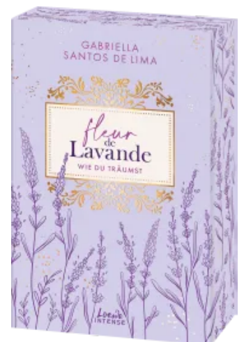
Fleur de Lavande (Band 3) - Wie du träumst Paperback