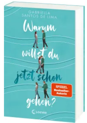
Warum willst du jetzt schon gehen? Paperback