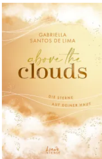
Above the Clouds (Band 3) - Die Sterne auf deiner Haut Paperback