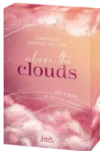
Above the Clouds (Band 1) - Der Himmel in deinen Farben Paperback