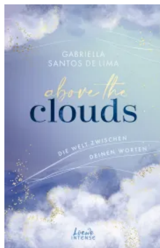
Above the Clouds (Band 2) - Die Welt zwischen deinen Worten Paperback