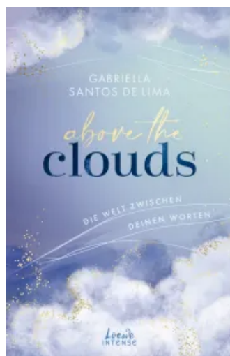
Above the Clouds (Band 2) - Die Welt zwischen deinen Worten Paperback