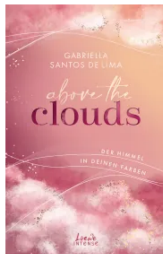
Above the Clouds (Band 1) - Der Himmel in deinen Farben Paperback