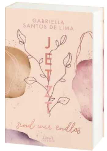
Jetzt sind wir endlos (Jetzt- Trilogie, Band 3) Paperback