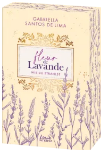
Fleur de Lavande (Band 2) - Wie du strahlst Paperback