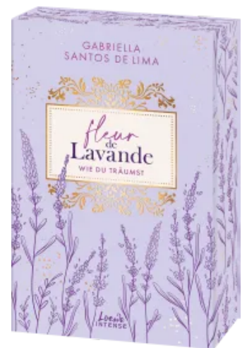
Fleur de Lavande (Band 3) - Wie du träumst Paperback