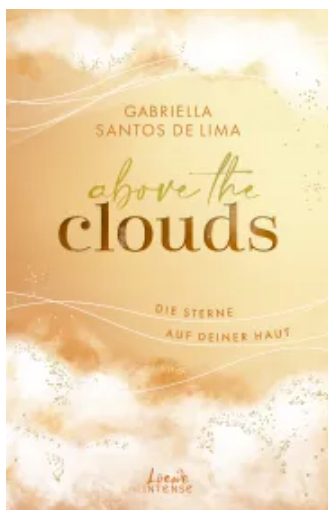
Above the Clouds (Band 3) - Die Sterne auf deiner Haut Paperback