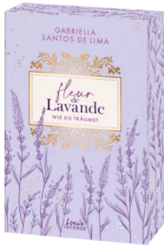
Fleur de Lavande (Band 3) - Wie du träumst Paperback