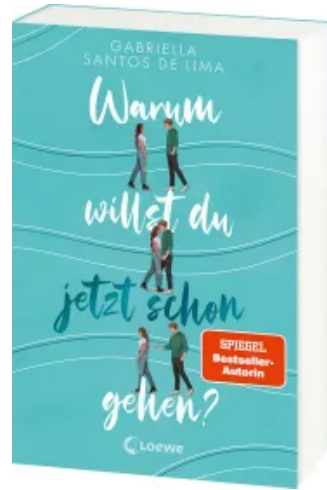
Warum willst du jetzt schon gehen? Paperback