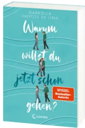
Warum willst du jetzt schon gehen? Paperback