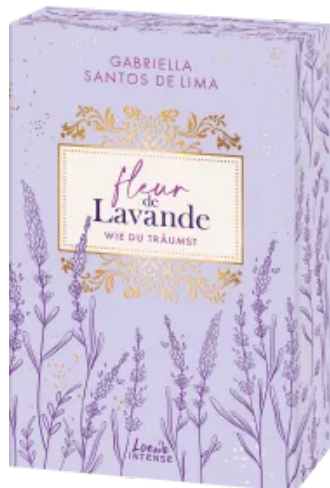
Fleur de Lavande (Band 3) - Wie du träumst Paperback