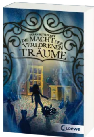
Die Macht der verlorenen Träume Taschenbuch