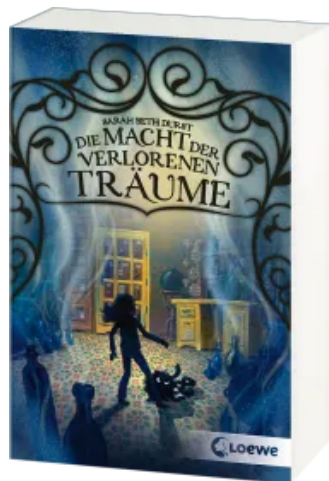
Die Macht der verlorenen Träume Taschenbuch