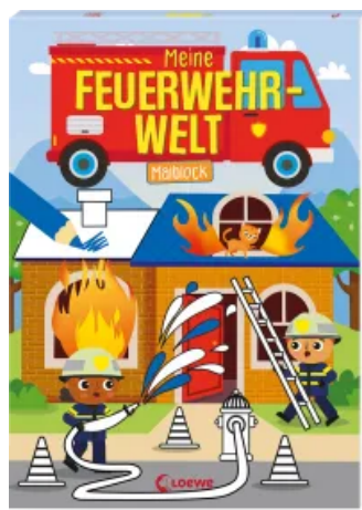
Meine Feuerwehr-Welt - Malblock Taschenbuch