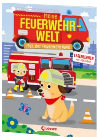
Meine Feuerwehr-Welt - Max, der Feuerwehrhund Taschenbuch