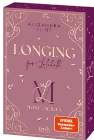
Mont Lacroix (Band 1) - Longing for Lelibeth