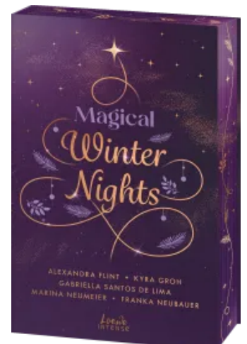
Magical Winter Nights Paperback