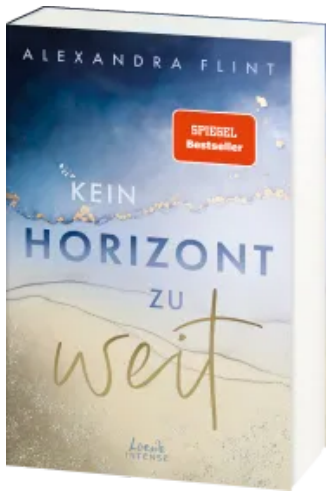
Kein Horizont zu weit (Tales of Sylt, Band 1)