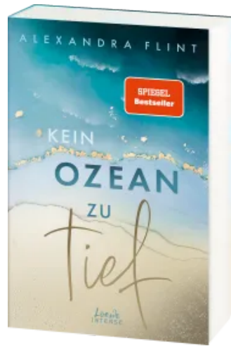
Kein Ozean zu tief (Tales of Sylt, Band 3)