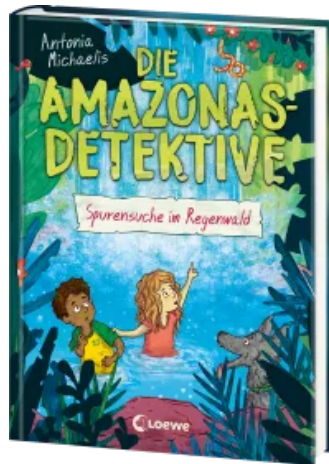
Die Amazonas-Detektive (Band 3) - Spurensuche im Regenwald Hardcover