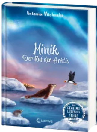
Das geheime Leben der Tiere (Ozean) - Minik - Der Ruf der Arktis Hardcover