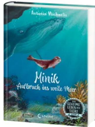
Das geheime Leben der Tiere (Ozean) - Minik - Aufbruch ins weite Meer Hardcover