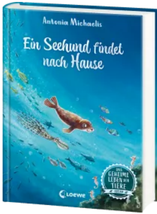
Das geheime Leben der Tiere (Ozean) - Ein Seehund findet nach Hause Hardcover