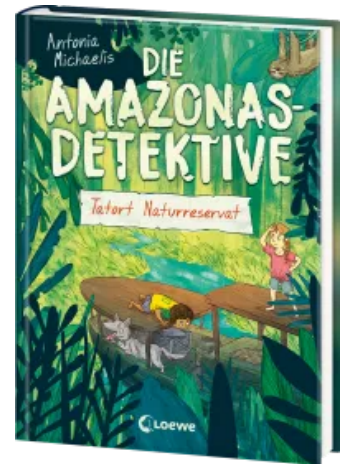
Die Amazonas-Detektive (Band 2) - Tatort Naturreservat Hardcover