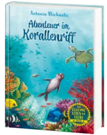
Das geheime Leben der Tiere (Ozean) - Abenteuer im Korallenriff Hardcover