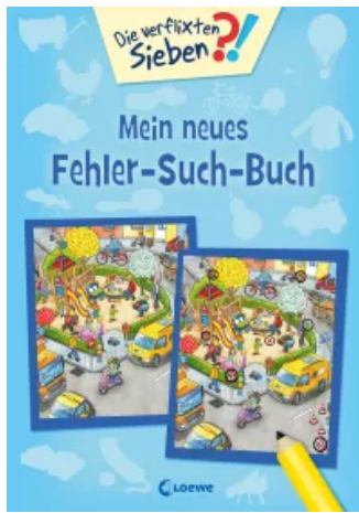
Die verflixten Sieben - Mein neues Fehler-Such-Buch Taschenbuch