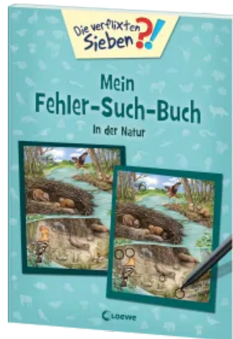
Die verflixten Sieben - Mein Fehler-Such-Buch - In der Natur Taschenbuch