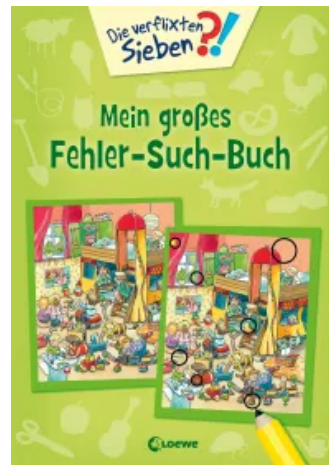
Die verflixten Sieben - Mein großes Fehler-Such-Buch Taschenbuch