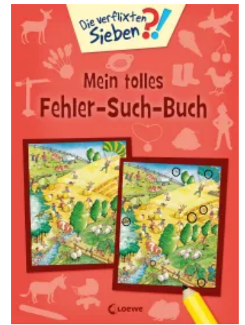
Die verflixten Sieben - Mein tolles Fehler-Such-Buch Taschenbuch