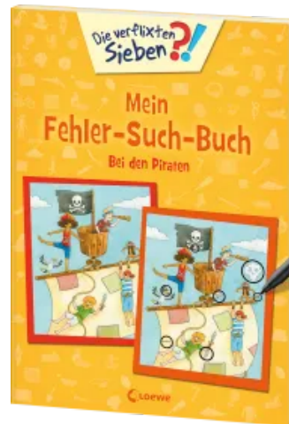
Die verflixten Sieben - Mein Fehler-Such-Buch - Bei den Piraten Taschenbuch