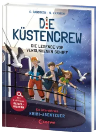
Die Küstencrew (Band 4) - Die Legende vom versunkenen Schiff Hardcover