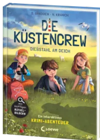
Die Küstencrew (Band 3) - Diebstahl am Deich Hardcover