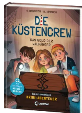
Die Küstencrew (Band 1) - Das Gold der Walfänger Hardcover