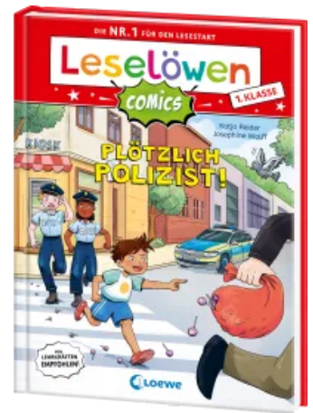
Leselöwen Comics 1. Klasse - Plötzlich Polizist! Hardcover