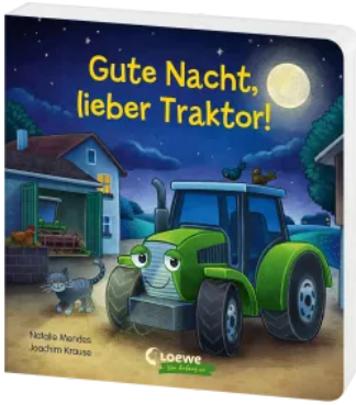
Gute Nacht, lieber Traktor! Hardcover