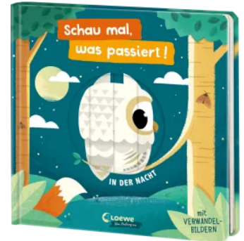
Schau mal, was passiert! In der Nacht Hardcover