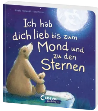
Ich hab dich lieb bis zum Mond und zu den Sternen Hardcover