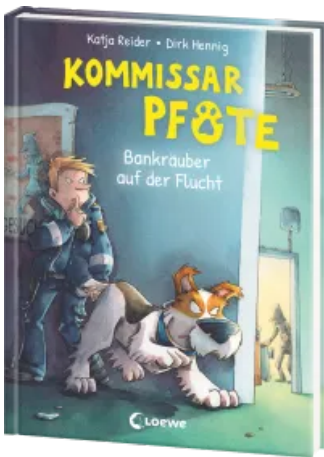
Kommissar Pfote (Band 10) - Bankräuber auf der Flucht Hardcover