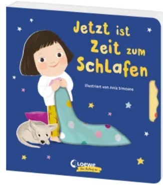
Jetzt ist Zeit zum Schlafen Hardcover