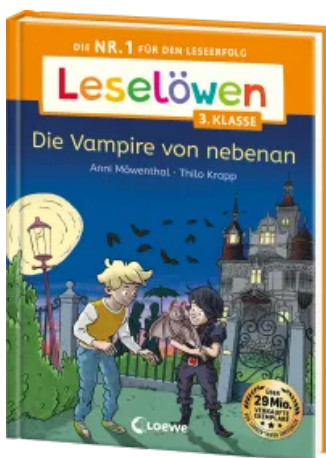
Leselöwen 3. Klasse - Die Vampire von nebenan Hardcover