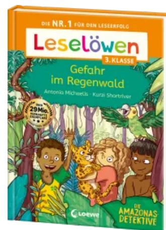
Leselöwen 3. Klasse - Amazonas-Detektive: Gefahr im Regenwald Hardcover