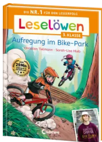
Leselöwen 3. Klasse - Aufregung im Bike-Park Hardcover