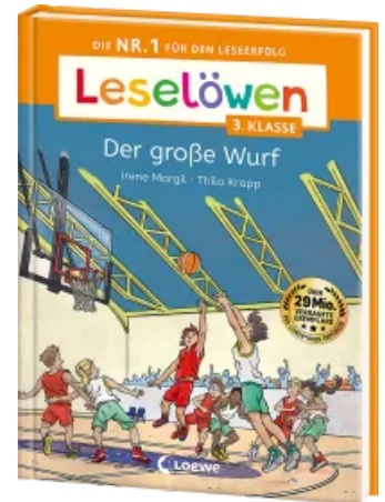
Leselöwen 3. Klasse - Der große Wurf Hardcover