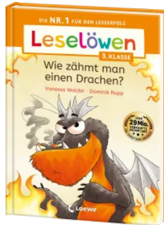
Leselöwen 3. Klasse - Wie zähmt man einen Drachen? Hardcover