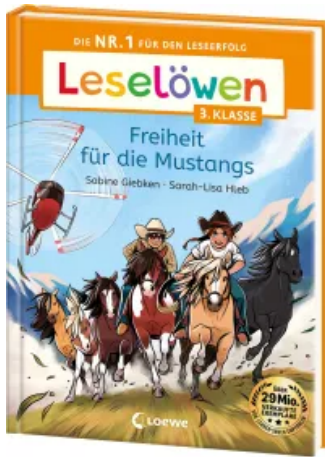
Leselöwen 3. Klasse - Freiheit für die Mustangs Hardcover