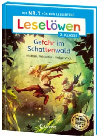
Leselöwen 2. Klasse - Gefahr im Schattenwald Hardcover