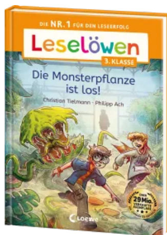
Leselöwen 3. Klasse - Die Monsterpflanze ist los! Hardcover