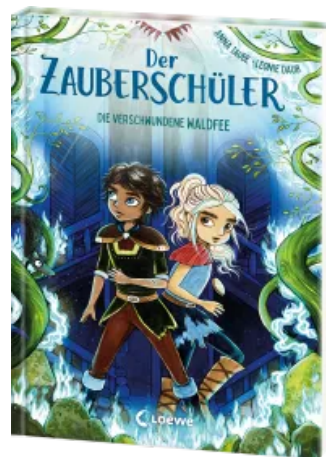
Der Zauberschüler (Band 7) - Die verschwundene Waldfee Hardcover