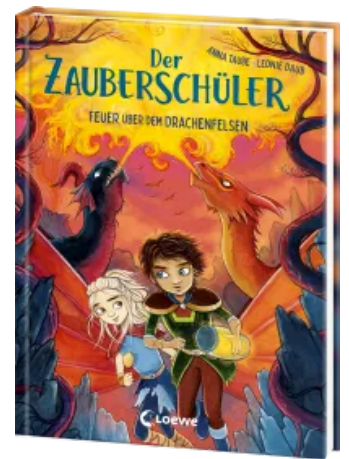
Der Zauberschüler (Band 6) - Feuer über dem Drachenfelsen Hardcover