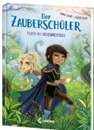
Der Zauberschüler (Band 1) - Fluch des Hexenmeisters Hardcover