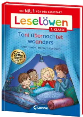
Leselöwen 1. Klasse - Toni übernachtet woanders Hardcover