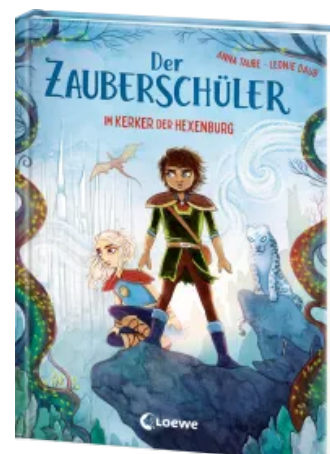
Der Zauberschüler (Band 5) - Im Kerker der Hexenburg Hardcover