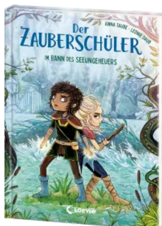
Der Zauberschüler (Band 2) - Im Bann des Seeungeheuers Hardcover