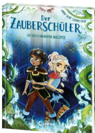
Der Zauberschüler (Band 7) - Die verschwundene Waldfee Hardcover