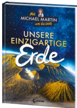
Mit Michael Martin um die Welt - Unsere einzigartige Erde Hardcover