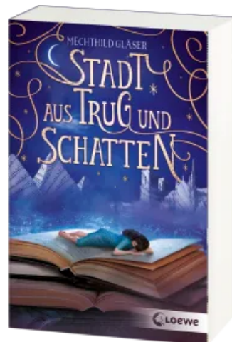
Stadt aus Trug und Schatten (Eisenheim- Dilogie, Band 1) Taschenbuch