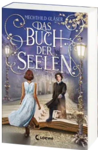
Das Buch der Seelen Paperback