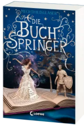
Die Buchspringer Taschenbuch