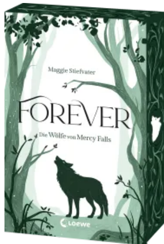
Forever (Die Wölfe von Mercy Falls, Band 3) Paperback