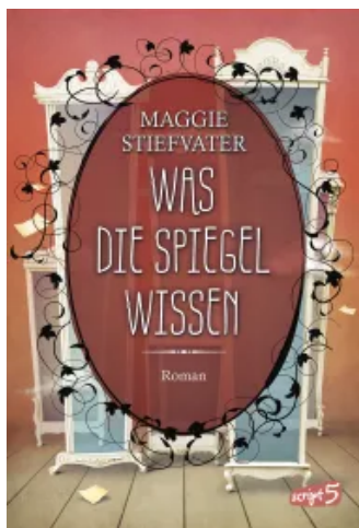
Was die Spiegel wissen (Raven Boys 3) Hardcover