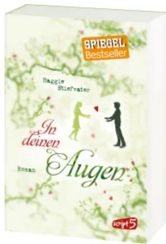
In deinen Augen Taschenbuch