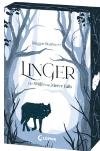
Linger (Die Wölfe von Mercy Falls, Band 2) Paperback