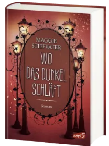
Wo das Dunkel schläft (Band 4) Hardcover