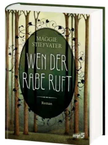
Wen der Rabe ruft (Band 1) Hardcover