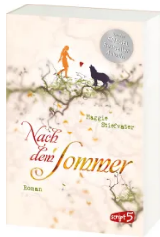
Nach dem Sommer Taschenbuch