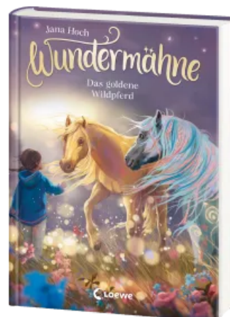
Wundermähne (Band 4) - Das goldene Wildpferd Hardcover