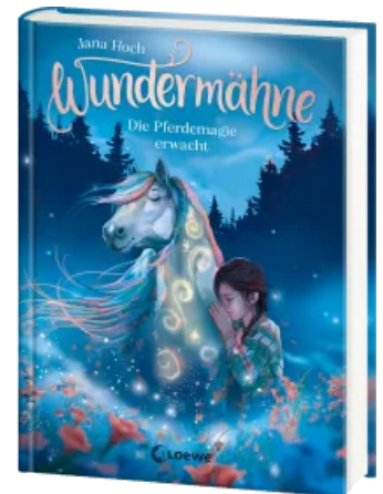
Wundermähne (Band 1) - Die Pferdemagie erwacht Hardcover