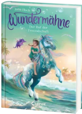
Wundermähne (Band 3) - Der Ruf der Freundschaft Hardcover