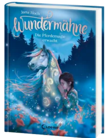
Wundermähne (Band 1) - Die Pferdemaie erwacht Hardcover