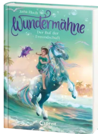
Wundermähne (Band 3) - Der Ruf der Freundschaft Hardcover