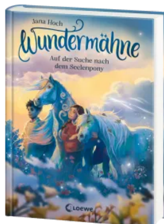
Wundermähne (Band 2) - Auf der Suche nach dem Seelenpony Hardcover