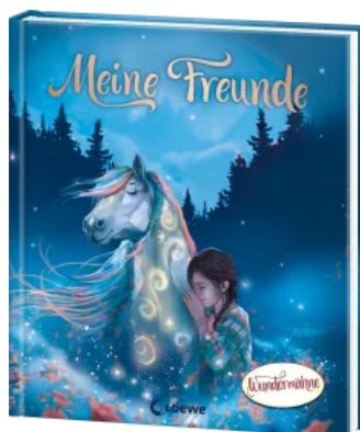
Meine Freunde (Wundermähne) Hardcover