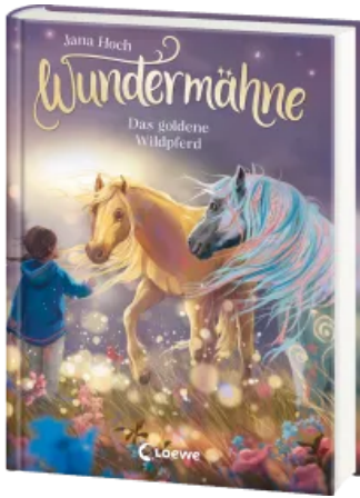
Wundermähne (Band 4) - Das goldene Wildpferd Hardcover