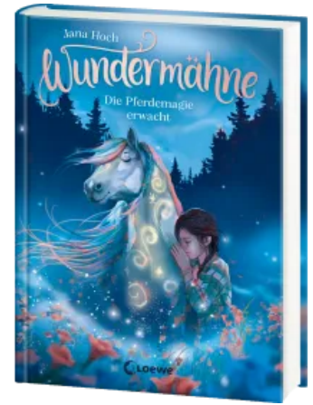
Wundermähne (Band 1) - Die Pferdemaie erwacht Hardcover