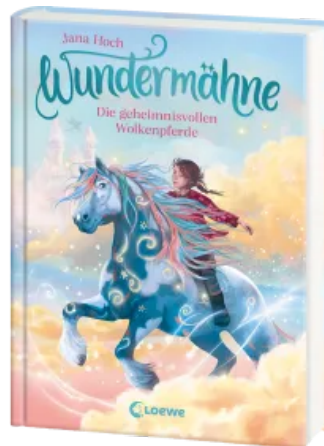
Wundermähne (Band 5) - Die geheimnisvollen Wolkenpferde Hardcover