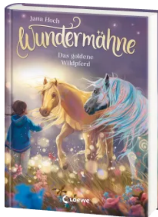
Wundermähne (Band 4) - Das goldene Wildpferd Hardcover