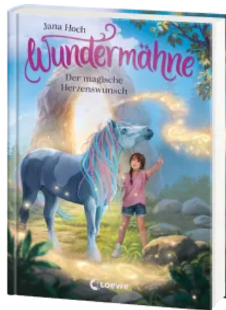
Wundermähne (Band 7) - Der magische Herzenswunsch Hardcover