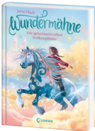
Wundermähne (Band 5) - Die geheimnisvollen Wolkenpferde Hardcover