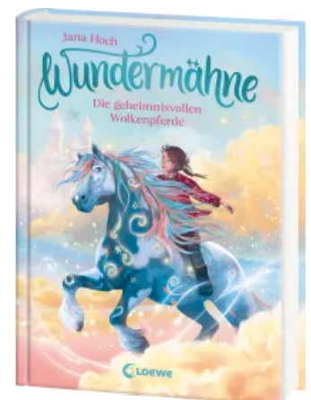
Wundermähne (Band 5) - Die geheimnisvollen Wolkenpferde Hardcover