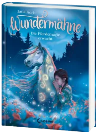
Wundermähne (Band 1) - Die Pferdemaie erwacht Hardcover