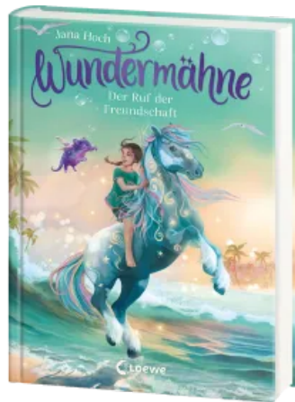
Wundermähne (Band 3) - Der Ruf der Freundschaft Hardcover