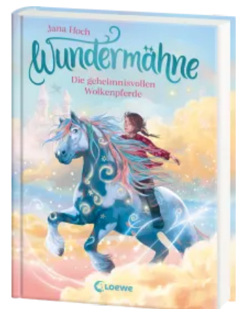
Wundermähe (Band 5) - Die geheimnisvollen Wolkenpferde Hardcover