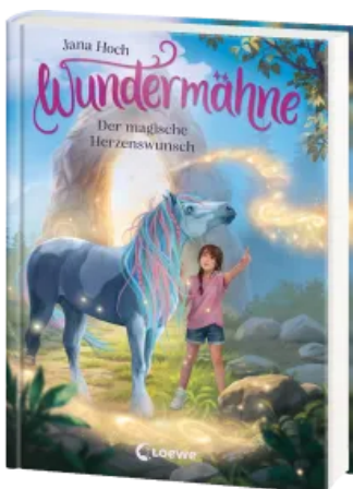
Wundermähne (Band 7) - Der magische Herzenswunsch Hardcover