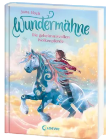
Wundermähne (Band 5) - Die geheimnisvollen Wolkenperle Hardcover