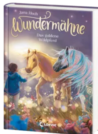
Wundermähe (Band 4) - Das goldene Wildpferd Hardcover