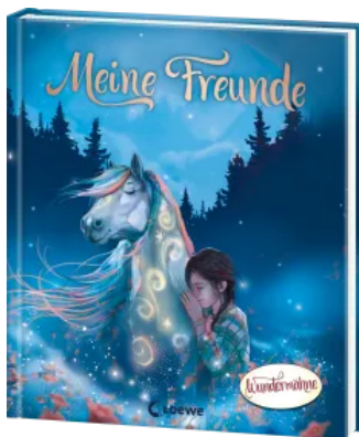
Meine Freunde (Wundermähe) Hardcover