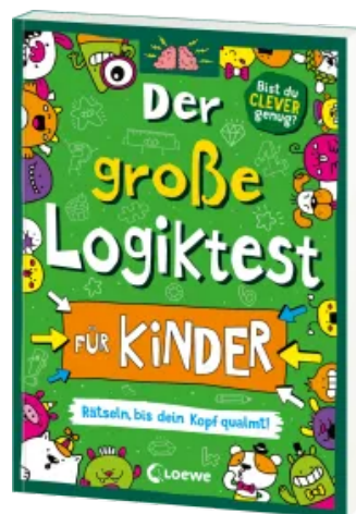
Der große Logiktest für Kinder - Rätseln, bis dein Kopf qualmt! Taschenbuch