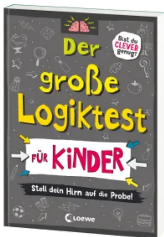
Der große Logiktest für Kinder - Stell dein Hirn auf die Probe! Taschenbuch