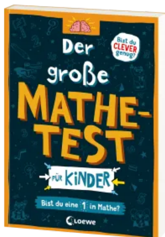
Der große Mathetest für Kinder - Bist du eine 1 in Mathe? Taschenbuch