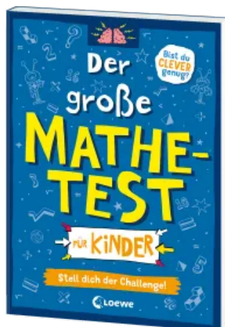
Der große Mathetest für Kinder - Stell dich der Challenge! Taschenbuch