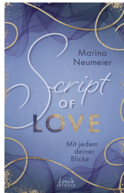
Script of Love - Mit jedem deiner Blicke (Love-Trilogie, Band 2)