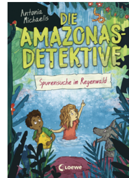
Die Amazonas-Detektive (Band 3) - Spurensuche im Regenwald