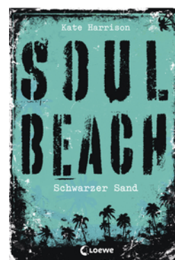
Soul Beach (Band 2) – Schwarzer Sand