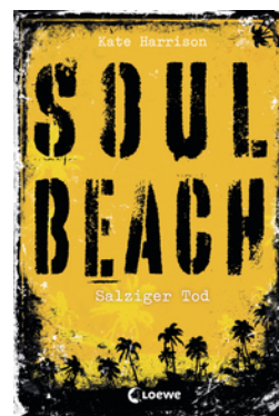
Soul Beach (Band 3) – Salziger Tod