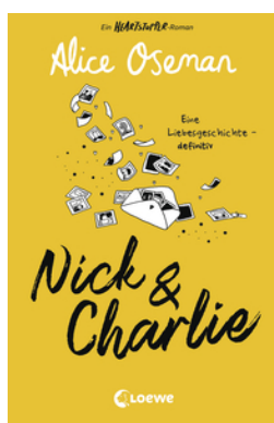
Nick & Charlie (deutsche Ausgabe)