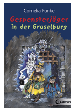
Gespensterjäger in der Gruselburg