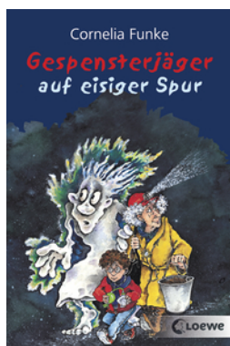
Gespensterjäger auf eisiger Spur