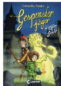
Gespensterjäger in großer Gefahr