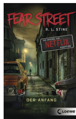
Fear Street - Der Anfang