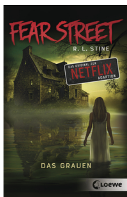
Fear Street - Das Grauen