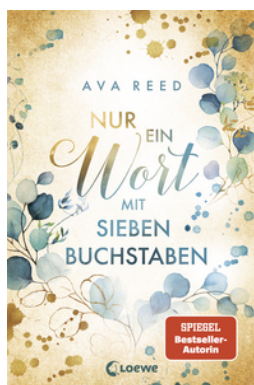
Nur ein Wort mit sieben Buchstaben