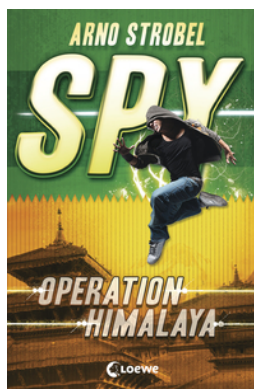
SPY (Band 3) - Operation Himalaya