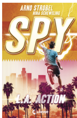
SPY (Band 4) - L.A. Action