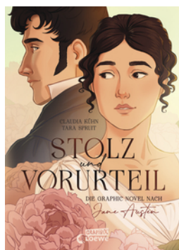
Stolz und Vorurteil