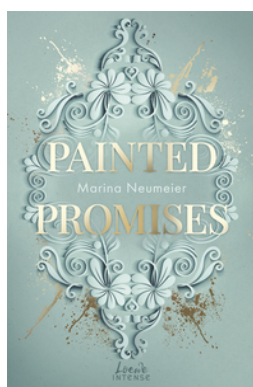
Painted Promises (Golden Hearts, Band 3)