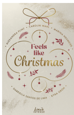
Feels like Christmas