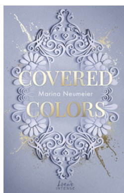
Covered Colors (Golden Hearts, Band 2)