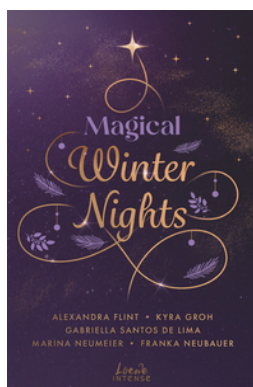
Magical Winter Nights