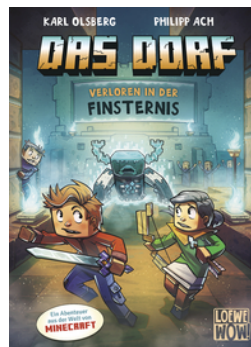
Das Dorf (Band 6) - Verloren in der Finsternis