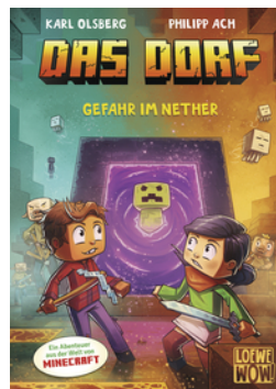
Das Dorf (Band 2) - Gefahr im Nether