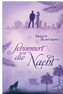
Schimmert die Nacht