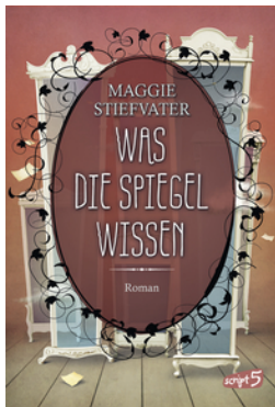
Was die Spiegel wissen (Band 3)