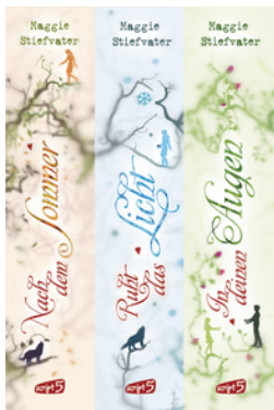
Nach dem Sommer/Ruht das Licht/In deinen Augen