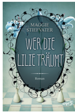
Wer die Lilie träumt (Band 2)