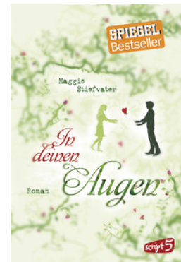
In deinen Augen