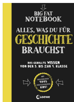
Big Fat Notebook - Alles, was du für Geschichte brauchst