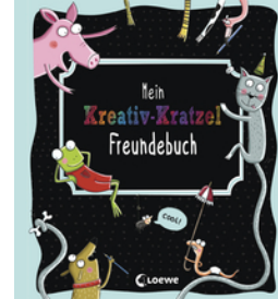
Mein Kreativ-Kratzel Freundebuch