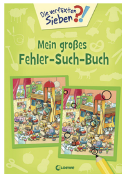
Die verfluchten Sieben - Mein großes Fehler-Such-Buch