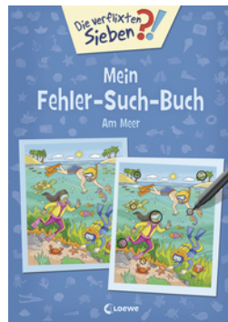
Die verfluchten Sieben - Mein Fehler-Such-Buch - Am Meer