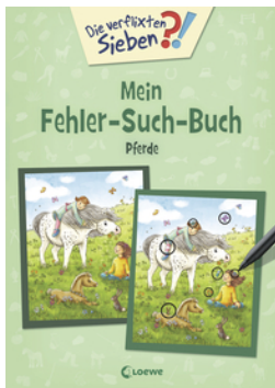
Die verfluchten Sieben - Mein Fehler-Such-Buch - Pferde