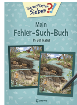
Die verfluchten Sieben - Mein Fehler-Such-Buch - In der Natur