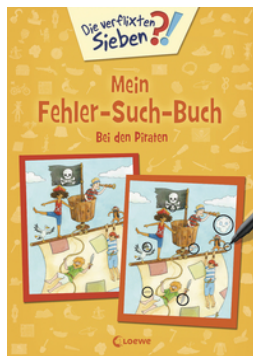
Die verfluchten Sieben - Mein Fehler-Such-Buch - Bei den Piraten