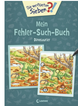
Die verfluchten Sieben - Mein Fehler-Such-Buch - Dinosaurier