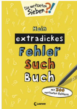
Mein extradickes Fehler-Such-Buch (gelb)