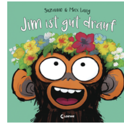
Jim ist gut drauf