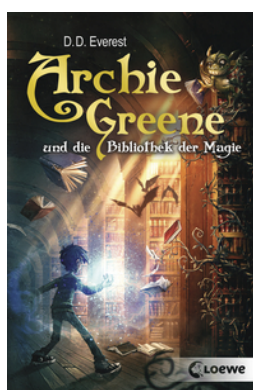
Archie Greene und die Bibliothek der Magie (Band 1)