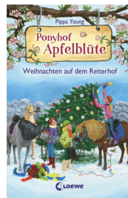
Ponyhof Apfelblüte - Weihnachten auf dem Reiterhof