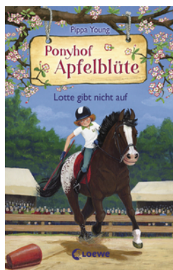
Ponyhof Apfelblüte (Band 23) - Lotte gibt nicht auf