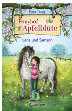
Ponyhof Apfelblüte (Band 1) - Lena und Samson