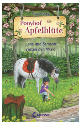
Ponyhof Apfelblüte (Band 22) - Lena und Samson retten den Wald