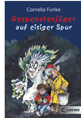
Gespensterjäger auf eisiger Spur