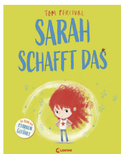
Sarah schafft das (Die Reihe der starken Gefühle)