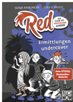
Red - Der Club der magischen Kinder (Band 2) - Ermittlungen undercover