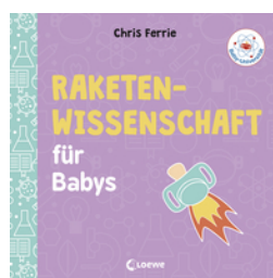
Baby-Universität - Raketenwissenschaft für Babys